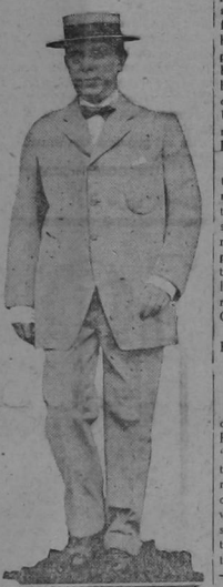
MARTIN H. GLYNN